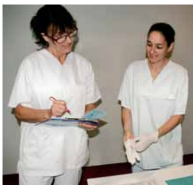
Abb. 2: Unterweisung vor Ort zu den Themen "Sterile Handschuhe anziehen" und "Blutabnahme".

Job Instruction ist optimal nutzbar für sich wiederholende Tätigkeiten. Insbesondere operative Tätigkeiten stehen hierbei im Vordergrund, also zum Beispiel viele alltägliche Tätigkeiten in den Funktionsdiensten von Krankenhäusern, in der Krankenpflege, in der Notaufnahme bzw. Ambulanz, in der Altenpflege, in medizinischen Laboren, in Rehabilitationseinrichtungen, Einrichtungen der ambulanten Patientenversorgung, Arztzentren u.v.m.