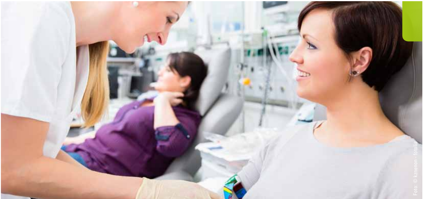
Abb. 1: Im Gesundheitswesen sind die Patienten gleichzeitig Konsumenten der Versorgungsleistung und Gegenstand der Leistung selbst.

versorgung zu verbessern. Der Einsatz von JI führt dazu, dass Mitarbeiterinnen und Mitarbeiter in der Praxis schnell lernen, Tätigkeiten sicher, gewissenhaft und in hoher Qualität durchzuführen. Die dadurch verbesserte tatsächliche Standardisierung ist Grundlage für die Stabilisierung und systematische Verbesserung vieler Abläufe.